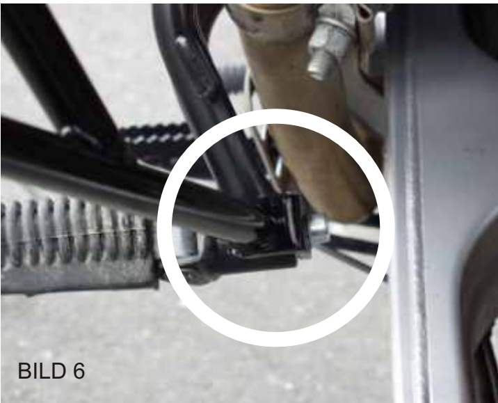
Klemmung Fußbraste linke Seite