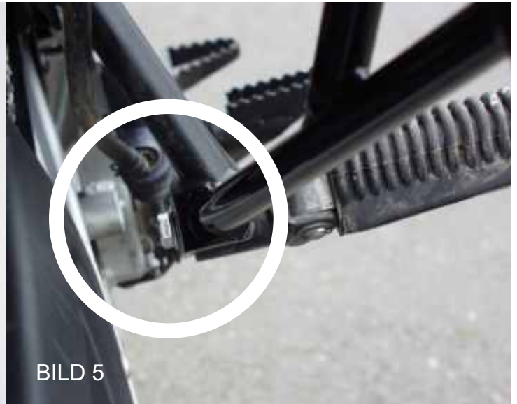
Klemmung Fußbraste rechte Seite